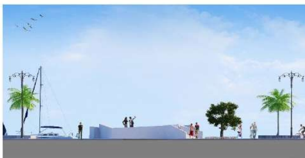
Sezione B Area Polivalente e Piazza sul Mare