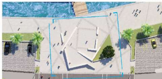
Piazza Chiave Area Polivalente e Piazza sul Mare