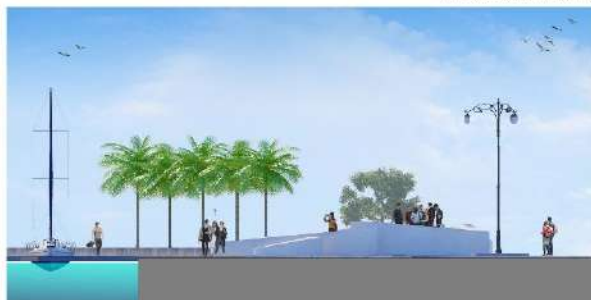
Sezione C Area Polivalente e Piazza sul Mare