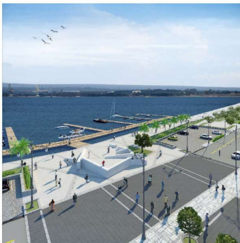
Rendering Vista a volo d'uccello, scorcio Mar Piccolo