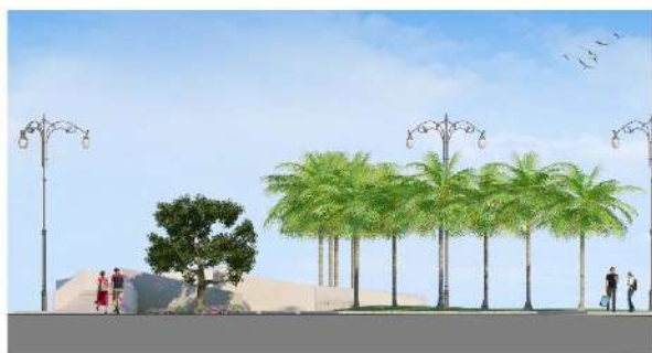
Sezione A Area Polivalente e Piazza sul Mare